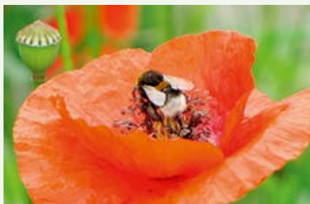
Klatschmohn Papaver rhoeas

jedes Jahr umgepflügt. Heute sieht man auf den Feldern nur noch selten die bunten Tupfen der Ackerwildkräuter. Im naturnahen Garten finden sie weiterhin ihren Platz.