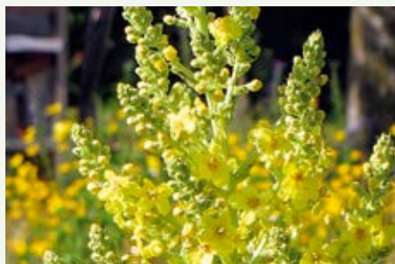
Großblütige Königskerze Verbascum densiflorum