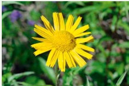
Ochsenauge Bupthalmum salicifolium