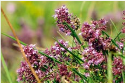
Breitblättriger Thymian Thymus pulegioides

Stauden sind mehrjährige krautige Pflanzen. Sie ziehen sich im Winter zurück und überdauern als Wurzelstöcke, Knollen oder Zwiebeln. Vermehren können sie sich sowohl über Ausläufer als auch über Samen. Wildstauden sind besonders robust und insektenfreundlich. Viele Wiesenblumen sind Wildstauden. Zur Geltung kommen sie aber auch ganz klassisch im Staudenbeet. Es gibt eine schier unüberschaubare Vielfalt an Farben und Formen, die man miteinander kombinieren kann: hohe und bodendeckende, schmale und ausladende, früh- und spätblühende.