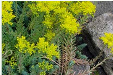
Felsen-Fetthenne Sedum reflexum