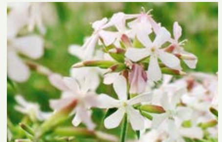
Gewöhnliches Seifenkraut Saponaria officinalis