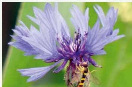
Kornblume Cyanus segetum