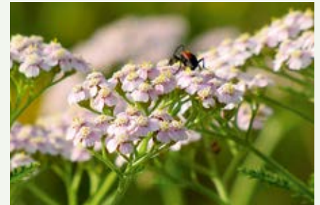
Gemeine Schafgarbe Achillea millefolium