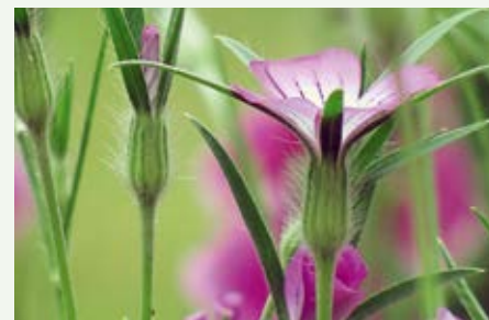
Kornrade Agrostemma githago