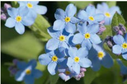
Sumpf-Vergissmeinnicht Myosotis palustris