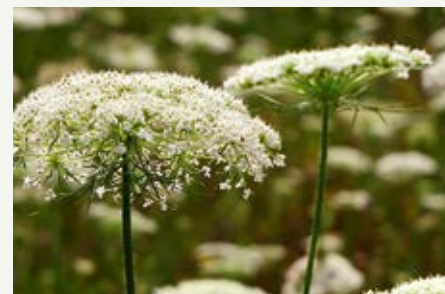
Wilde Möhre Daucus carota subsp. carota