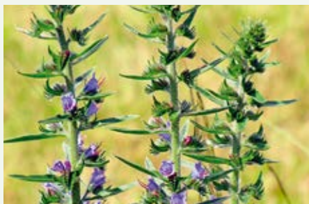
Gewöhnlicher Natternkopf Echium vulgare

nur eine unscheinbare Blattrosette aus. Im zweiten Jahr starten sie dann durch, blühen prächtig und verteilen ihre Samen.